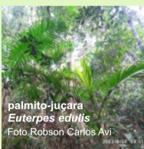
palmito-juçara Euterpes edulis