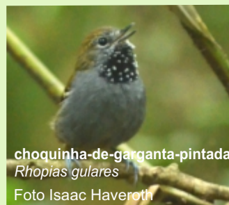
choquinha-de-garganta-pintada Rhopias gularis