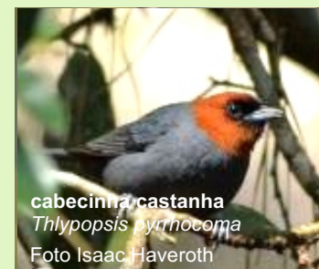
cabecinha-castanha Thlypopsis castanha