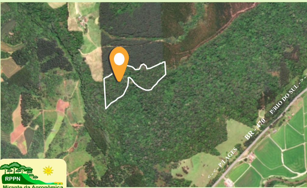
Imagem de satélite 2022